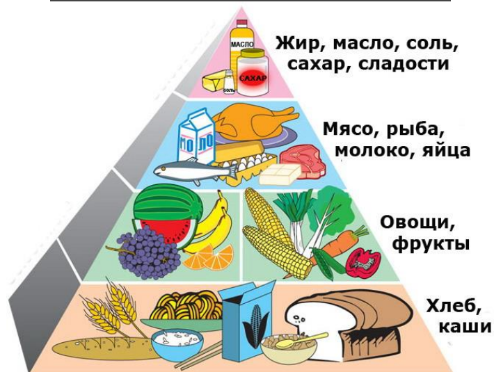
Пирамида здорового питания

К составлению полноценного рациона школьника требуется глубокий подход с учетом специфики детского организма. Освоение школьных программ требует от детей высокой умственной активности. Маленький человек, приобщающийся к знаниям, не только выполняет тяжелый труд, но одновременно и растет, развивается, и для всего этого он должен получать полноценное питание. Напряженная умственная деятельность, непривычная для первоклассников, связана со значительными затратами энергии.